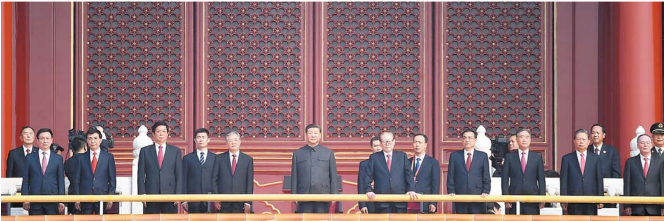
10 - ئاينىڭ 1 - كۈنى، جۇڭخۇا خەلق جۇمھۇرىيىتى قۇرۇلغانلىقىنىڭ 70 يىللىقىنى تەبرىكلەش يىغىنى بېيجىڭ تېنەنمېن مەيدانىدا داغدۇغىلىق ئۆتكۈزۈلدى. سۈرەتتە: جۇڭگو كوممۇنىستىك پارتىيەسى مەركىزىي كومىتېتىنىڭ باش شۇجىسى، دۆلەت رەئىسى، مەركىزىي ھەربىي كومىتېتىنىڭ رەئىسى شى جىنپىڭ قاتارلىقلار تېنەنمېن راۋىقىدا.

ئالغا ئىلگىرلەش مۇساپىسىدە، بىز جۇڭگو كوممۇنىستىك پارتىيەسىنىڭ رەھبەرلىكىدە چىڭ تۇرۇپ، خەلقنىڭ سۈيىيىكتە-لىق ئورنىدا چىڭ تۇرۇپ، جۇڭگوچە سوتسىيالىزم يولىدا چىڭ تۇرۇپ، پارتىيەنىڭ ئاساسىي نەزەرىيەسى، ئاساسىي لۇشېننى، ئاساسىي تەدبىرنى ئومۇميۈزلۈك ئىزچىلاشتۇرۇپ، ئىجرا قىلىپ، خەلقنىڭ گۈزەل تۇرمۇشقا بولغان ئىستىلا-شىنى ئۈزلۈكسىز قاندۇرۇپ، يېڭى تارىخىي ئۇلۇغ ئىشلارنى ئۈزلۈكسىز يارىتىشىمىز كېرەك. بىز «تىنچ بىرلىككە كېلىش، بىر دۆلەت ئىككى تۈزۈم» قانۇنىدا چىڭ تۇرۇپ، شياڭگاڭ، ئاۋمېنىڭ ئۆزاقچى گۈللىنىشى، مۇقىم بولۇشىنى ساقلاپ، دېڭىز بوغۇزى ئىككى قىرغىقى مۇناسىۋىتىنىڭ تىنچ تەرەققىي قىلىشىغا تۈرتكە بولۇپ، بارلىق جۇڭخۇا ئوغۇل-قىزلىرىنى ئىستىپاقلاشتۇرۇپ، ۋەتەننىڭ تولۇق بىرلىككە كېلىشىنى ئىشقا ئاشۇرۇش ئۈچۈن داۋاملىق كۈرەش قىلىشىمىز كېرەك. بىز تىنچ تەرەققىي قىلىش يولىدا چىڭ تۇرۇپ، ئۆزئارا مەنپەئەت يەتكۈزۈپ، ئورتاق پايدا ئالدىغان ئېچىۋېتىش ئىستى-راتىپىگە سىڭە ئەمەل قىلىپ، داۋاملىق تۈردە دۇنيادىكى ھەرقايسى دۆلەت خەلقلىرى بىلەن بىرلىكتە ئىنسانىيەت تەقدىرى ئورتاق گەۋدىسىنى ئورتاق بەرپا قىلىشقا تۈرتكە بولۇشىمىز كېرەك. جۇڭگو خەلق ئازادلىق ئارمىيەسى ۋە خەلق قوراللىق ساقچى قىسىمى خەلق ئارمىيەسىنىڭ خاراكتېرى، ئاساسىي مەقسىتى، خىسلىتىنى مەڭگۈ ساقلاپ، دۆلەتنىڭ ئىگىلىك ھوقۇقى، خەۋپ-سىزلىكى، تەرەققىيات مەنپەئىتىنى قەتئىي قوغدىشى، دۇنيا تىنچلىقىنى قەتئىي قوغدىشى كېرەك.