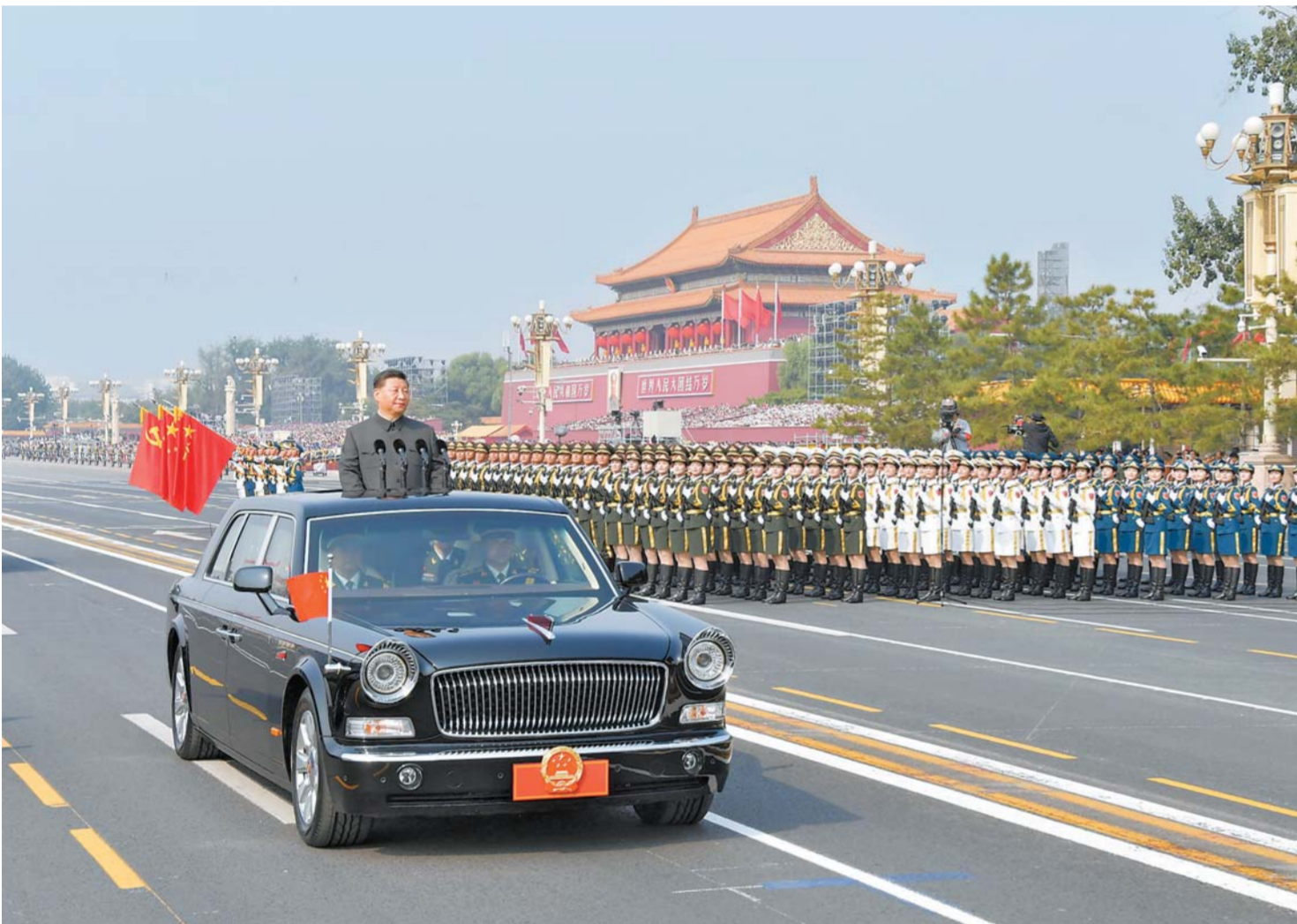
10 - ئاينىڭ 1 - كۈنى، جۇڭخۇا خەلق جۇمھۇرىيىتى قۇرۇلغانلىقىنىڭ 70 يىللىقىنى تەبرىكلەش يىغىنى بېيجىڭ تېنەنمېن مەيدانىدا داغدۇغىلىق ئۆتكۈزۈلدى. سۈرەتتە: جۇڭگو كوممۇنىستىك پارتىيەسى مەركىزىي كومىتېتىنىڭ باش شۇجىسى، دۆلەت رەئىسى، مەركىزىي ھەربىي كومىتېتىنىڭ رەئىسى شى جىنپىڭ پاراتتىن ئۆتكەن قىسىملارنى كۆزدىن كەچۈرمەكتە.

لى كېچىڭ رىياسەتچىلىك قىلدى لى جەنشۈ، ۋاڭ ياك، ۋاڭ خۇنىڭ، جاۋ لېجى، خەن جېڭ، ۋاڭ چىشەن، جياڭ زېمېن، خۇ جىنتاۋ قاتناشتى