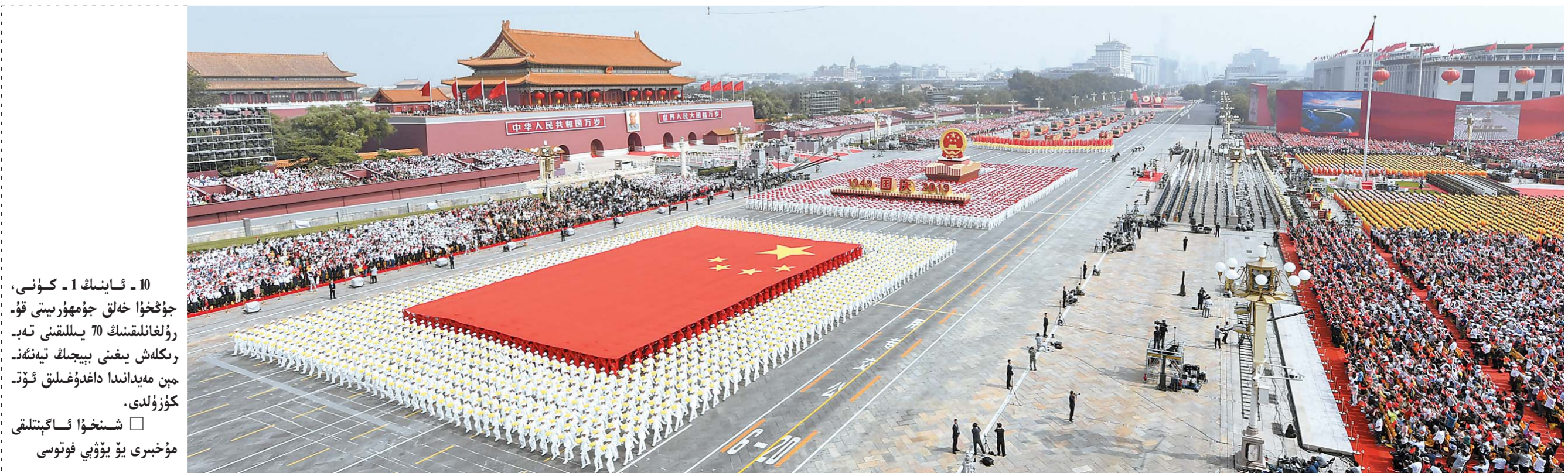
10 - ئاينىڭ 1 - كۈنى، جۇڭخۇا خەلق جۇمھۇرىيىتى قۇ-رۇلغانلىقىنىڭ 70 يىللىقىنى تەب-رىكلەش يىغىنى بېيجىڭ تېنەنم-ېن مەيدانىدا داغدۇغىلىق ئۆت-كۈزۈلدى.

شىنخۇا ئاگېنتلىقى، بېيجىڭ، 10 - ئاينىڭ 1 - كۈنى تېلېگ-راممىسى ئۇلۇغۋار 70 يىل، يېڭى دەۋردە ئىلگىرلەش. 10 - ئاينىڭ 1 - كۈنى چۈشتىن بۇرۇن، جۇڭخۇا خەلق جۇمھۇرىيىتى قۇرۇلغانلى-قىنىڭ 70 يىللىقىنى تەبرىكلەش يىغىنى بېيجىڭ تېنەنمېن مەيدانىدا داغدۇغىلىق ئۆتكۈزۈلدى، 200 مىڭدىن ئارتۇق ئارمىيە، خەلق كاتتا ھەربىي پارات مۇراسىمى ۋە ئامما نامايىشى ئارقىلىق جۇمھۇ-رىيەتنىڭ 70 يىللىق تۇغۇلغان كۈنىنى خۇشال - خۇرام تەبرىكلدى. جۇڭگو كوممۇنىستىك پارتىيەسى مەركىزىي كومىتېتىنىڭ باش شۇ-جىسى، دۆلەت رەئىسى، مەركىزىي ھەربىي كومىتېتىنىڭ رەئىسى شى جىنپىڭ مۇھىم سۆز قىلدى ھەم پاراتتىن ئۆتكەن قىسىملارنى