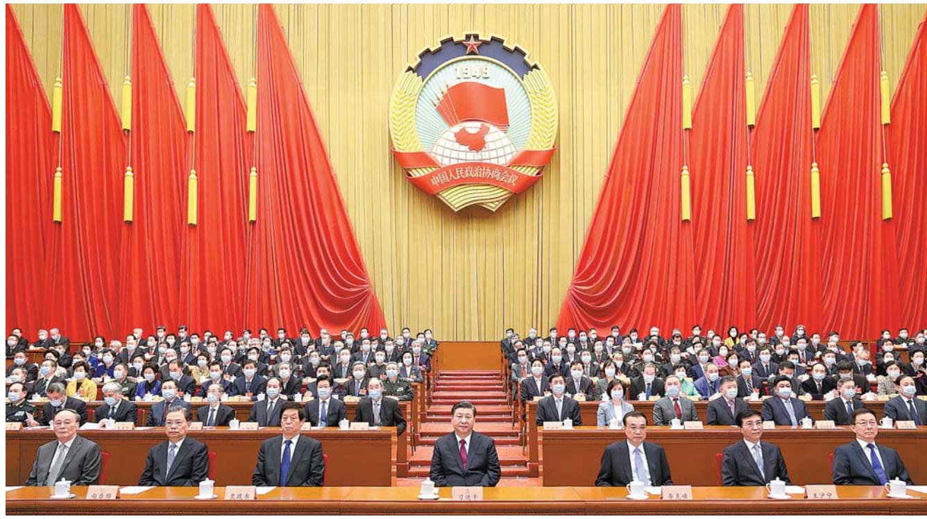
3 - ئاينىڭ 10 - كۈنى، ۋاڭ خۇنڭ، لى جەنشۇ، ۋاڭ خۇنڭ، جاۋ لېجى، خەن جېڭ، ۋاڭ چىشەن قاتارلىقلار رەئىس سەھنىسىدىن ئورۇن ئالدى، ۋاڭ ياڭ يېيىلىشى يىغىنىغا رىياسەتچىلىك قىلدى ھەم سۆز قىلدى.

شىنخۇئا ئاگېنتلىقى، بېيجىڭ، 3 - ئاينىڭ 10 - كۈنى تېلېگراممىسى جۇڭگو خەلق سەھنىسى مەسئۇلىيەت كېڭەشچىسى ۋاڭ خۇنڭ ۋە ئۇنىڭ مەملىكەتلىك كومىتېتى 4 - يىغىنى تۈرلۈك قاراللىقنى تولۇق تاماملاپ، 3 - ئاينىڭ 10 - كۈنى چۈشتىن كېيىن خەلق سەھنىسىدە يىغىندا، خەلق سەھنىسى مەسئۇلىيەت كېڭەشچىسى ھەر دەرىجىلىك تەشكىلاتلىرى، ھەرقايسى قاتناشقان ئورۇنلار ۋە كەڭ سىياسىي كېڭەش ئەزا-لىرى يولداش شى جىنپىڭ ياد-رولۇقىدىكى جۇڭگو كوممۇنىستىك پارتىيەسى مەركىزىي كومىتېتىنىڭ ئەتراپىغا تېخىمۇ زىچ ئىستىپا قىلىشى، قەلب ۋە كۈچنى مۇجەسسەملەپ تەرەققىياتىنى ئىلگىرى سۈرۈپ، ۋە-زىيەتكە تايىنىپ ئالغا ئىلگىرى-لەپ يېڭى ۋەزىيەت ئېچىپ، جۇڭخۇا مىللىتىنىڭ ئۇلۇغ گۈل-لىنىشىدىن ئىبارەت جۇڭگو ئار-