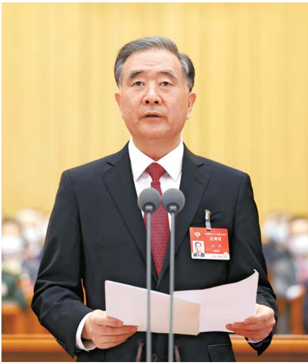
3 - ئاينىڭ 10 - كۈنى، ۋاڭ خۇنڭ خەلق سەھنىسىدىن ئورۇن ئالدى، ۋاڭ ياڭ يېيىلىشى يىغىنىغا رىياسەتچىلىك قىلدى ھەم سۆز قىلدى.

قىسقىچە، 3 - ئاينىڭ 10 - كۈنى، ۋاڭ خۇنڭ خەلق سەھنىسىدىن ئورۇن ئالدى، ۋاڭ ياڭ يېيىلىشى يىغىنىغا رىياسەتچىلىك قىلدى ھەم سۆز قىلدى.