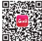
ئانا بۇلۇت تېرەپىنىلىك جۇنۇرۇپ قانچۇنۇلۇك