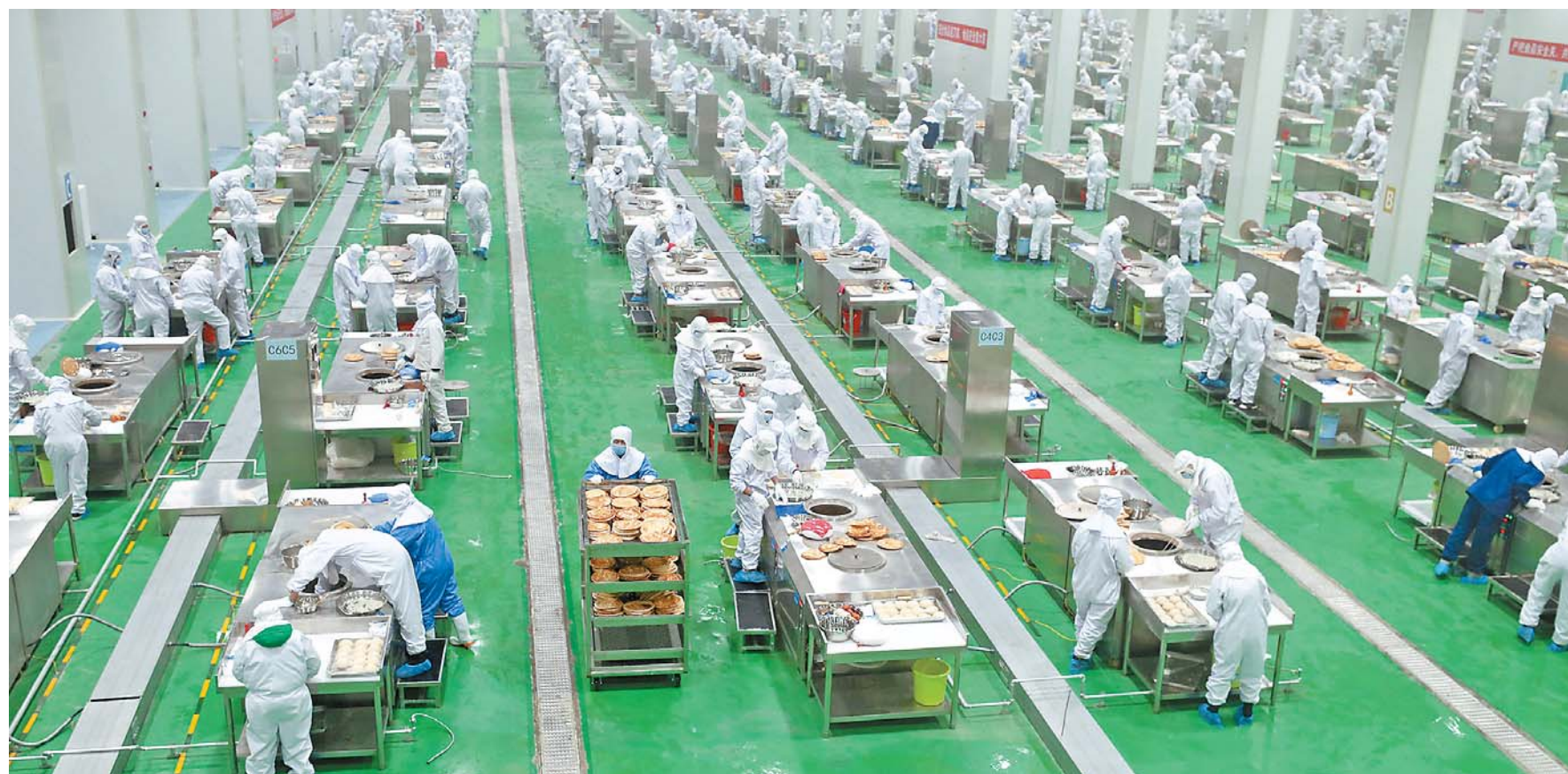
1 - ئاينىڭ 23 - كۈنى، ئىشچى - خىزمەتچىلەر ئىشلەپچىقىرىش سېخىدا نان ياقماقتا. نۆۋەتتە، ئۈرۈمچى شەھىرى نان مەدەنىيىتى كەسپلەر باغچىسىنىڭ 2 - قارارىدا 51 مىڭ كۋادرات مېتىر زىۋۇت ئۆيى سېلىنىپ، 1800 كە يېقىن كىشىنى قوبۇل قىلىپ ئىشقا ئورۇنلاشتۇردى.

سدا تارقاق ئولتۇراقلىشىپ چارۋا باقىدىغان چارۋىچىلارنى بۇ يەرگە كۆچۈرۈپ كېلىپ مەركەزلىك ئولتۇراقلاشتۇردى. 2014 - يىلى، سەنجاڭسۆزى كەنتى ئاپتونوم رايون دەرىجىلىك نامراتلارنى يۆلەش تىكى نۇقتىلىق كەنت قاتارىغا كىرگۈزۈلدى، كەنتتە ئىزاخىپ تۇرغۇزۇلۇپ كارتا بېجىرىلگەن 198 نامرات ئائىلىلىك 746 كىشى بولۇپ، ئېرىپولنىڭ ئائىلىسىمۇ بۇنىڭ ئىچىدە ئىدى. 2015 - يىلى، يېزا - كەنت كادىرلىرىنىڭ يېتەكچىلىكىدە، ئېرىپول نامراتلارنى يۆلەش ياردەم ئۆسۈملۈك قەرز بۆلىمىسىگە قاتنىشىپ، بىر نەچچە تۇياق تۆگە سېتىۋېلىپ، (ئاخىرى 4 - بەتتە)