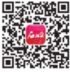
ئانار بۇلۇت تېرەپتالنى جۇڭبۇرۇپ قانچىلۇپنىڭ

شىنخۇا ئاگېنتلىقى ، بېيجىڭ، 1 - ئاينىڭ 11 - كۈنى تېلېگراممىسى 1 - ئاينىڭ 11 - كۈنى ، جۇڭگو كوممۇنىستىك پارتىيەسى مەركىزىي كومىتېتىنىڭ باش شۇجىسى شى جىنپىڭ جىن جېڭنىڭ تەبىرىدا پارىيەدا مۇناسىۋەتلىك ئىشلىرىنى قىلىشقا ئىشەنچلىك بىر مەزگىلگە ئىگە ئىدى. ئۇنىڭ چاۋشيەن يىدا چاۋشيەن ئەمگەكچىلەر پارتىيەسىنىڭ باش شۇجىسىغا سايلانغانلىقىنى ئىشەنچلىك بىر مەزگىلگە ئىگە ئىدى.