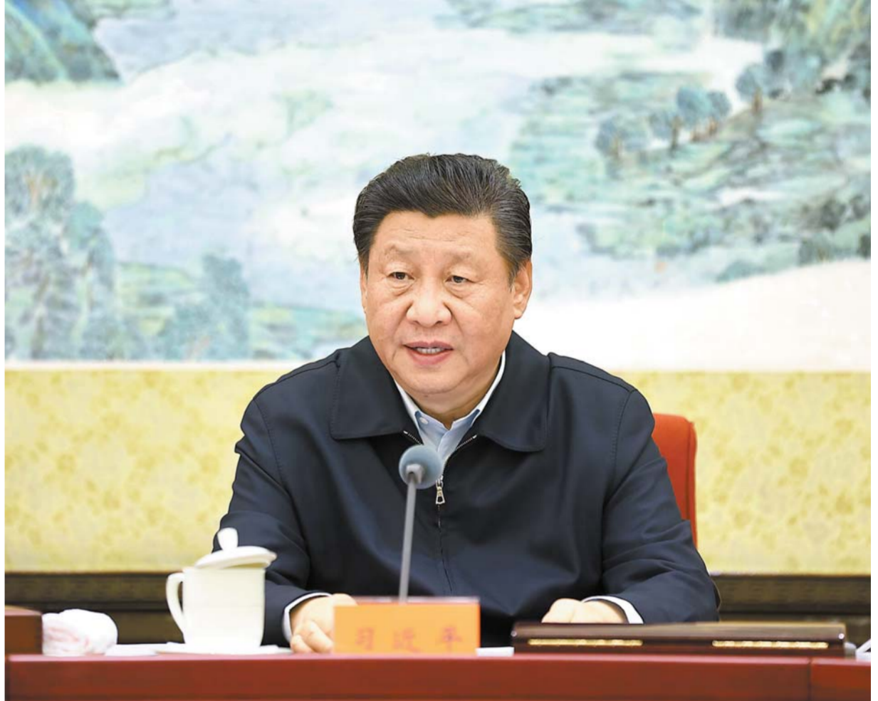
12 - ئاينىڭ 24 - كۈنىدىن 25 - كۈنىگىچە، جۇڭگو كوممۇنىستىك پارتىيەسى مەركىزىي كومىتېتى سىياسىي بىيۇروسى دېموكراتىك تۇرمۇش يىغىنى ئاچتى، جۇڭگو كوممۇنىستىك پارتىيەسى مەركىزىي كومىتېتىنىڭ باش شۇجىسى شى جىنپىڭ يىغىنغا رىياسەتچىلىك قىلدى ھەم مۇھىم سۆز قىلدى.