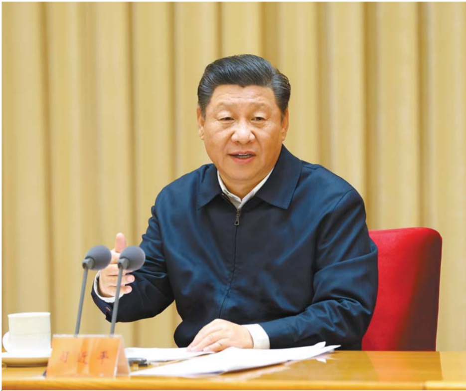
11 - ئاينىڭ 16 - كۈنىدىن 17 - كۈنىگىچە، مەركەزنىڭ دۆلەتنى ئومۇميۈزلۈك قانۇن بويىچە ئىدارە قىلىش خىزمىتى يىغىنى بېيجىڭدا ئېچىلدى. جۇڭگو كوممۇنىستىك پارتىيەسى مەركىزىي كومىتېتىنىڭ باش شۇجىسى، دۆلەت رەئىسى، مەركىزىي ھەربىي كومىتېتىنىڭ رەئىسى شى جىنپىڭ يىغىنغا قاتناشتى ھەم مۇھىم سۆز قىلدى. □ شىنخۇئا ئاگېنتلىقى مۇخبىرى پاك شىڭيى فوتوسى