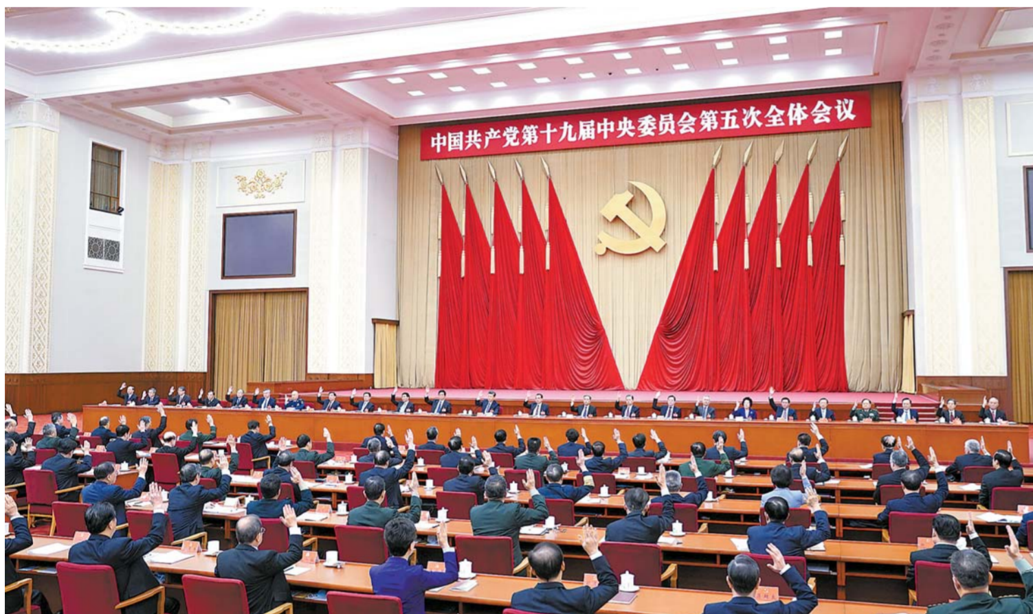
جۇڭگو كوممۇنىستىك پارتىيەسى 19 - نۆۋەتلىك مەركىزىي كومىتېتى 5 - ئومۇمىي يىغىنى 2020 - يىلى 10 - ئاينىڭ 26 - كۈنىدىن 29 - كۈنىگىچە بېيجىڭدا ئۆتكۈزۈلدى. مەركىزىي كومىتېت سىياسىي بىيۇروسى يىغىنغا رىياسەتچىلىك قىلدى.

ئومۇمىي يىغىندا شى جىنپىڭنىڭ مەركىزىي كومىتېت سىياسىي بىيۇروسىنىڭ ھاۋالىسى بىلەن بەرگەن خىزمەت دوكلاتى ئاڭلاپ ئۆتۈلدى ۋە مۇزاكىرە قىلىندى ئومۇمىي يىغىندا «جۇڭگو كوممۇنىستىك پارتىيەسى مەركىزىي كومىتېتىنىڭ خەلق ئىگىلىكى ۋە جەمئىيەت تەرەققىياتىنىڭ 14 - بەش يىللىق يېرىك پىلانى ۋە 2035 - يىلىغىچە بولغان كەلگۈسى نىشاننى تۈزۈش توغرىسىدىكى تەكلىپى» قاراپ چىقىلىپ ماقۇللاندى ئومۇمىي يىغىندا، پۈتۈن پارتىيە، پۈتۈن مەملىكەتتىكى ھەر مىللەت خەلقىنى يولداش شى جىنپىڭ يادرولۇقىدىكى پارتىيە مەركىزىي كومىتېتىنىڭ ئەتراپىغا زىچ ئىتتىپاقلىشىپ، بىر نىيەت، بىر مەقسەتتە بولۇپ، قەيسەرلىك بىلەن كۈرەش قىلىپ، ئومۇمىيۈزلۈك سوتسىيالىستىك زامانىۋىلاشقان دۆلەت قۇرۇشنىڭ يېڭى غەلبىسىنى قولغا كەلتۈرۈش چاقىرىقىنى قىلىندى