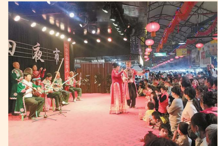
10 - ئاينىڭ 3 - كۈنى، ساياھەتچىلەر خوتەن كەچلىك بازىرىدا ناخشا - ئۇسسۇل نومۇرلىرىنى كۆرۈمەكتە.