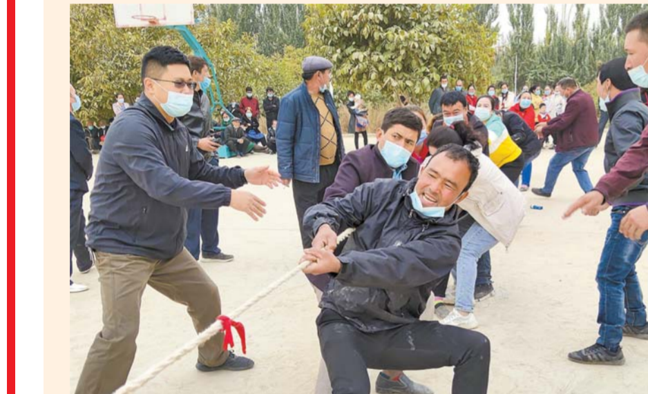
10 - ئاينىڭ 1 - كۈنى، يەكەن ناھىيەسىنىڭ خاڭدى بازىرى كەنتىدە «ئەتراپىنى بىلىش، ئەلگە نەپ يەتكۈزۈش، ئەلنى مائىل قىلىش» خىزمەت ئەترىتىنىڭ ئەتراپ كەنت ئاھالىلىرى بىلەن ئىبارەت گامجا تارتىش مۇسابىقىسى ئۆتكۈزۈلدى.