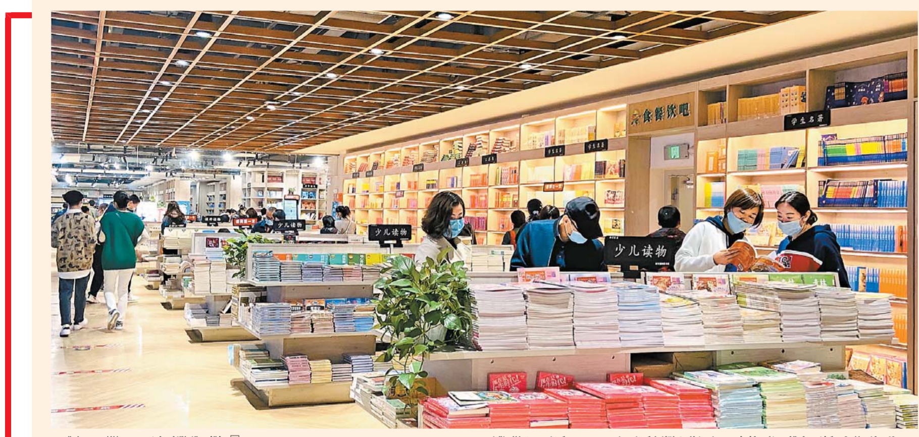
10 - ئاينىڭ 2 - كۈنى، ئوقۇرمەنلەر ئۈرۈمچى شىنخۇا خەلقئارا كىتاب شەھەرچىسىدە كىتاب سېتىۋالماقتا.