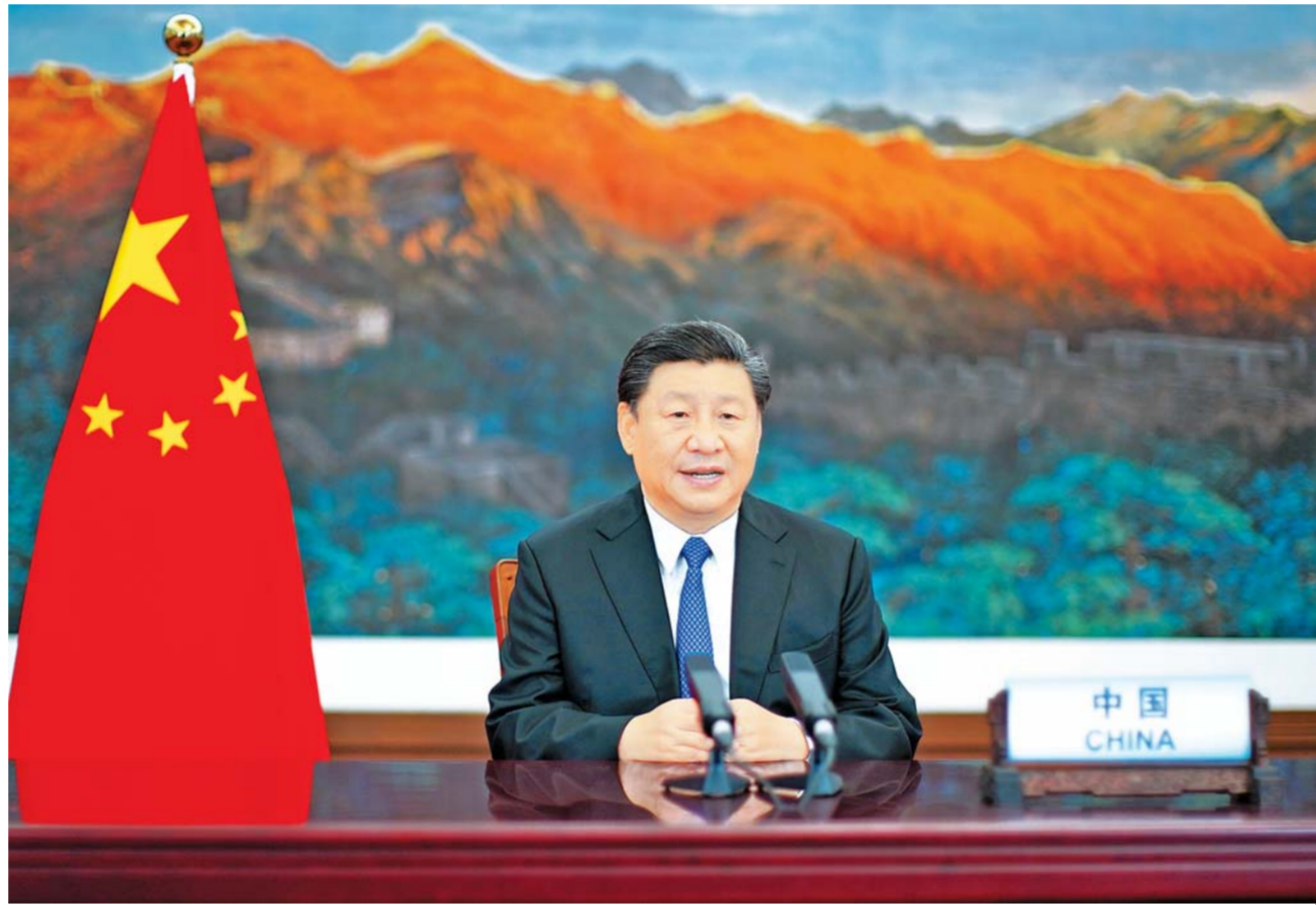
10 - ئاينىڭ 1 - كۈنى، دۆلەت رەئىسى شى جىنپىڭ بىرلەشكەن دۆلەتلەر تەشكىلاتى يىغىنىنىڭ بېيجىڭ دۇنيا ئاياللار يىغىنىنىڭ 25 يىللىقىنى خاتىرىلەش يۇقىرى دەرىجىلىكلەر يىغىنىدا مۇھىم سۆز قىلدى.

ئايلارنىڭ يۇقۇمىنىڭ تەسرىدىن قۇتۇلۇشقا ياردەم بېرىش، جىنسى باراۋەرلىكى دەل جايدا ئەمەلىيلەشتۈرۈش، ئاياللارنىڭ دەۋرىنىڭ ئالدىدا مېڭىشىغا تۈرتكە بولۇش، يەر شارنى ئاياللار ئىشلىرى ھەمكارلىقىنى كۈچەيتىشىنى تەشەببۇس قىلدى. 2025 - يىلى يەر شارنى ئاياللار باشلىقلار يىغىنى يەنە بىر قېتىم ئېچىشنى تەشەببۇس قىلدى.