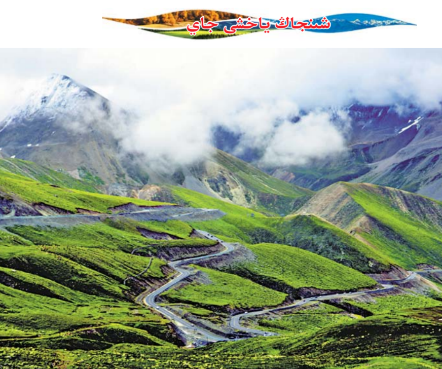
شىنجاڭ ياخشى جاي

مۇھىم ئامىللارنى تېز توپلاش يول قۇرۇلۇشىنى تېزلىتىش